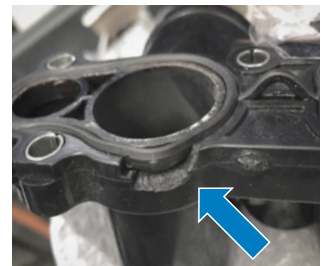
Fig. 3: Quebra (imagem do dano)