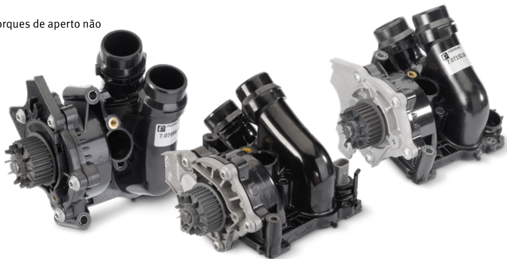
Fig. 1: Vista do produto

Reservadas alterações e divergências de imagens. Para alterações relativas à atribuição e substituição, ver os respectivos catálogos válidos ou os sistemas baseados na TecAlliance. * Os números de referência indicados servem apenas para efeitos comparativos e não podem ser utilizados em faturas para os consumidores finais.