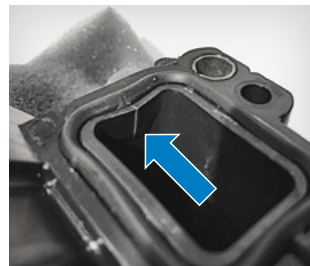
Fig. 2: Quebra (imagem do dano)

Por esse motivo, é importante seguir as instruções de montagem anexas.