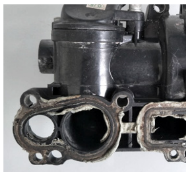
Fig. 5: Vazamentos devido a produtos de vedação adicionais (imagem do dano)