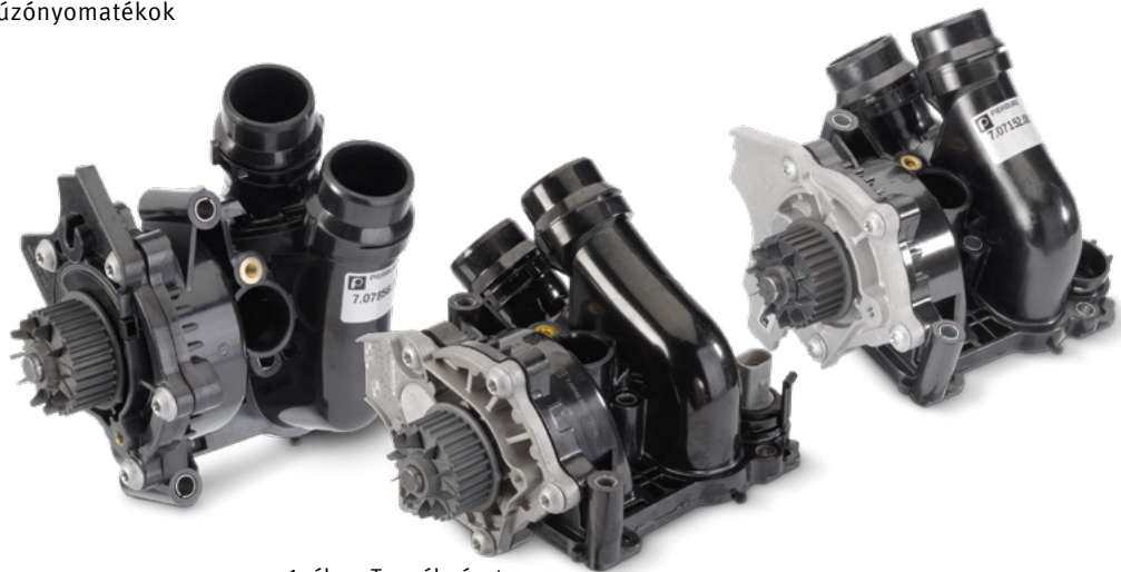
1. ábra: Terméknézet

Ezért feltétlenül tartsa be a mellékelt szerelési útmutatót.