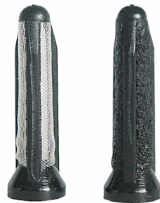
Prefiltro della pompa E1F: a sinistra nuovo, a destra intasato