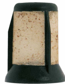
Prefiltro della pompa E3T – intasato dalla ruggine

La maggior parte delle pompe di alimentazione carburante moderne viene attraversata dal carburante e quindi contemporaneamente lubrificata e raffreddata. Se questo flusso attraverso la pompa risulta insufficiente, ad es. a causa dello sporco, sussiste il rischio del “funzionamento a secco”. Le pompe di alimentazione carburante delle serie E1F, E2T e E3T dispongono di un prefiltro incorporato sul lato di aspirazione. Questo piccolo “prefiltro” protegge la pompa dalla penetrazione di impurità. La sporcizia presente nel carburante aspirato può intasarlo. Le pompe di alimentazione carburante sono adatte solo per benzina.