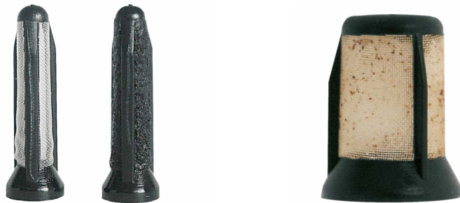
Préfiltre de la E1F : neuf à gauche, obstrué à droite