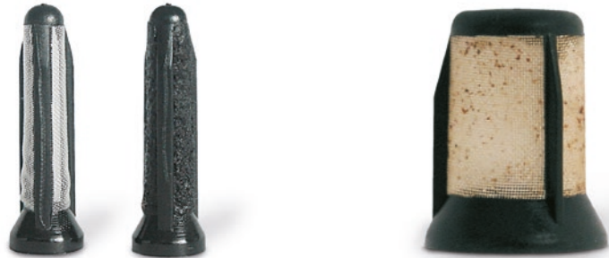
E1F 的预滤清器:左侧为全新,右侧为已堵塞