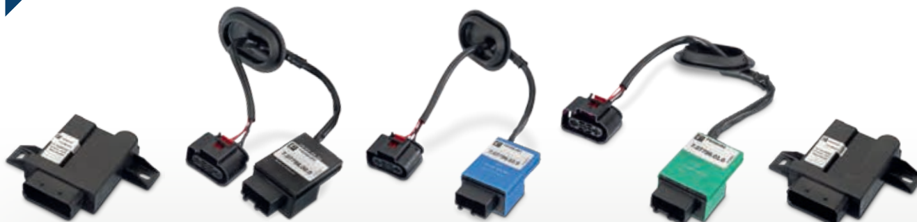
Illustrasjon som viser produkt