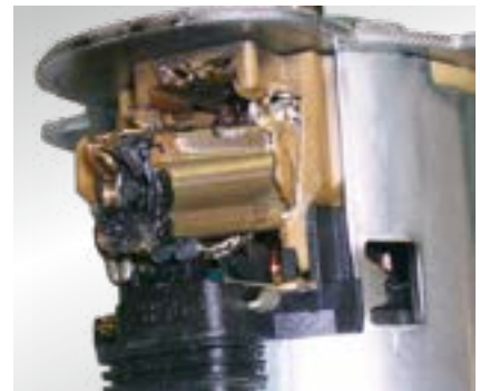
Obraz uszkodzenia: ślady nadtopienia na silniku elektrycznym albo na stykach elektrycznych

Prawo do zmian i odchyłeń rysunków zastrzeżone. Przyporządkowanie i części zastępcze patrz obowiązujące katalogi lub systemy oparte na danych TecAlliance.