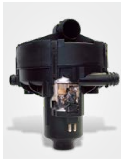
Vista della pompa aria secondaria (sezione) con tracce di materiale fuso

Il calore che si viene a formare riscalda inoltre il catalizzatore e riduce il periodo di tempo che manca allo sfruttamento della regolazione lambda.