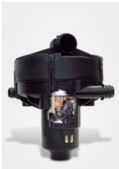
查看二次空气泵内部 (剖面) 带有熔痕