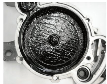
Fig. 3: Crusta de ulei din pompa de vid de la vehiculul comercial VW Transporter duce la apariția huruiturilor

O reclamație similară poate apărea și la montarea unei pompe de vid inadecvate cu un tchet prea scurt (03).