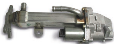
图 1: 带 EGR 冷却器的 EGR 阀

找寻冷却剂损失原因时,为避免昂贵与耗时的发动机维修,应在打开发动机前准确检查 EGR 冷却器是否存在泄漏。