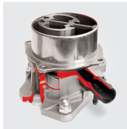
Современная модель: Однолопастный вакуумный насос (вид в разрезе)

Вопрос возможности дальнейшей эксплуатации масляного насоса на отремонтированном двигателе: Вакуумные насосы крепятся к двигателю и, в зависимости от типа конструкции, подсоединяются к контуру циркуляции моторного масла. Последствиями произошедшего повреждения двигателя могут являться: