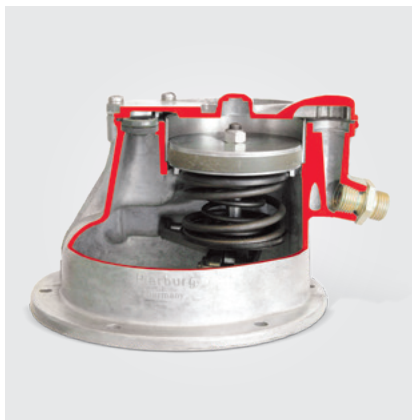
Классический поршневой вакуумный насос (вид в разрезе)