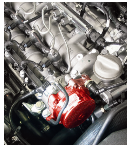
Pompa per vuoto in una Opel Vectra C (evidenziata)

Con riserva di modifiche e differenze rispetto alle figure. Classificazione e ricambi, vedere i cataloghi in vigore o i sistemi basati su TecAlliance.