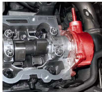
Pompa per vuoto e albero a camme in una Opel Vectra B (evidenziata)