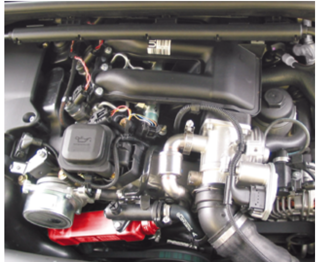
EGR-koeler in een BMW 318d (rood geaccentueerd)

Het begrip „stikstof” is een verzamelaanduiding voor de gasvormige oxiden van stikstof. Ze worden met \text{NO}_x afgekort, omdat er op grond van de vele oxidatietreden meerdere stikstof-zuurstof-verbindingen zijn. Stikstof irriteert en beschadigt de ademhalingsorganen, is mede verantwoordelijk voor smog- en ozonvorming en ondersteunt de vorming van zure regen.