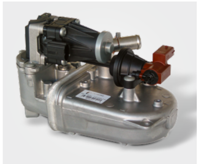
Pierburg EGR-koelermodule met geïntegreerde EGR-klep en bypassklep, ingebouwd bij Fiat en GM