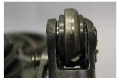
Imagem do dano: roldana desgastada de um lado

O cesto de montagem (3) não pode voltar a ser instalado depois da montagem de uma bomba de vácuo nova.