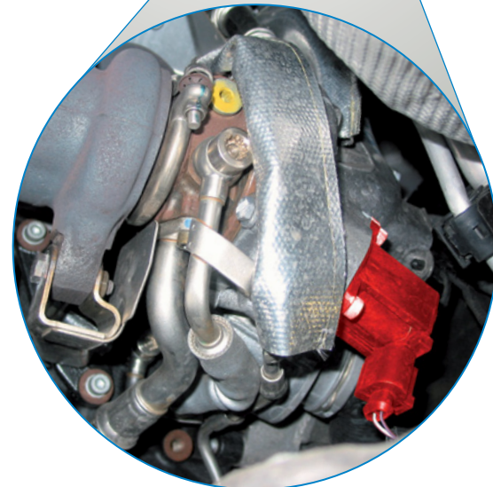
Valvola di ricircolo dell'aria in fase di rilascio nella VW EOS TFSI (evidenziata in rosso)