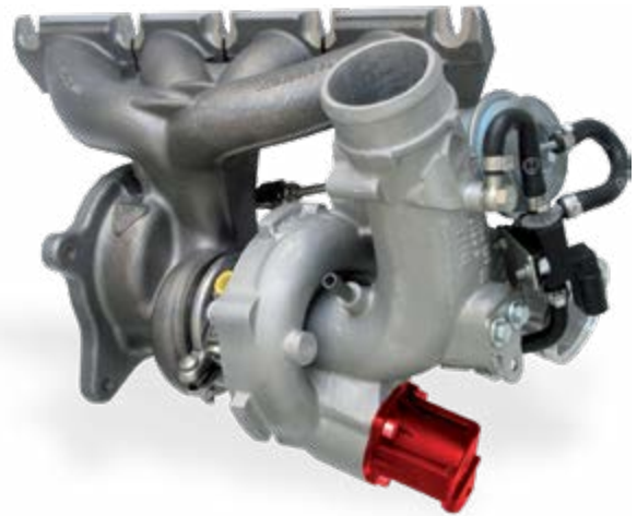
Schubumluftventil (rot hervorgehoben) am Turbolader eines Audi A3 2.0 TFSI