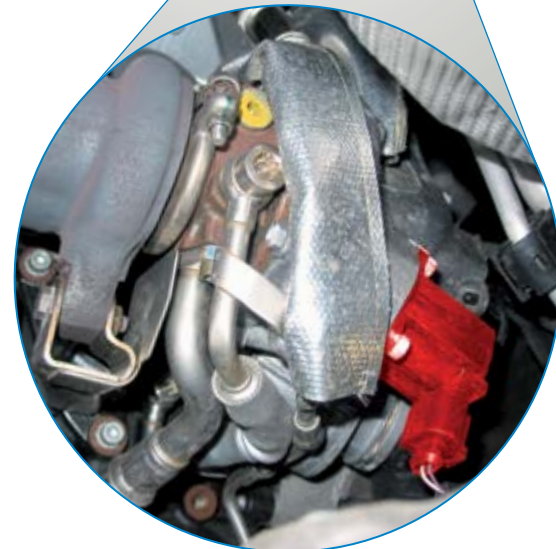
Schubumluftventil im VW EOS TFSI (rot hervorgehoben)