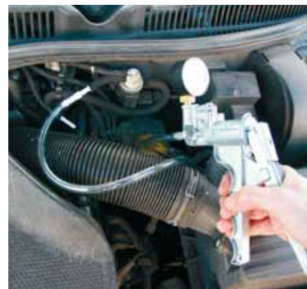
Ať již jde o pneumatické ventily AGR nebo zde EPW: pomocí ručního podtlakového čerpadla je možno snadno zkontrolovat jejich funkci.