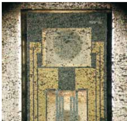
Sůl a nečistoty mohou poškodit snímač hmotnosti vzduchu – přinejmenším však mohou zkreslit výsledky měření, což opět může ovlivnit funkci AGR.