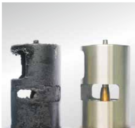
Ventily AGR se samy o sobě nemohou znečistit sazemi, a proto musí být vypátrána příčina vzniku sazí.

Vadný konstrukční díl je třeba vždy vyměnit za nový.