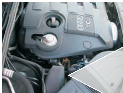
Пример: турбонагнетатель с переменной геометрией турбины и EPW (выделены красным цветом) в Audi A4 TDI