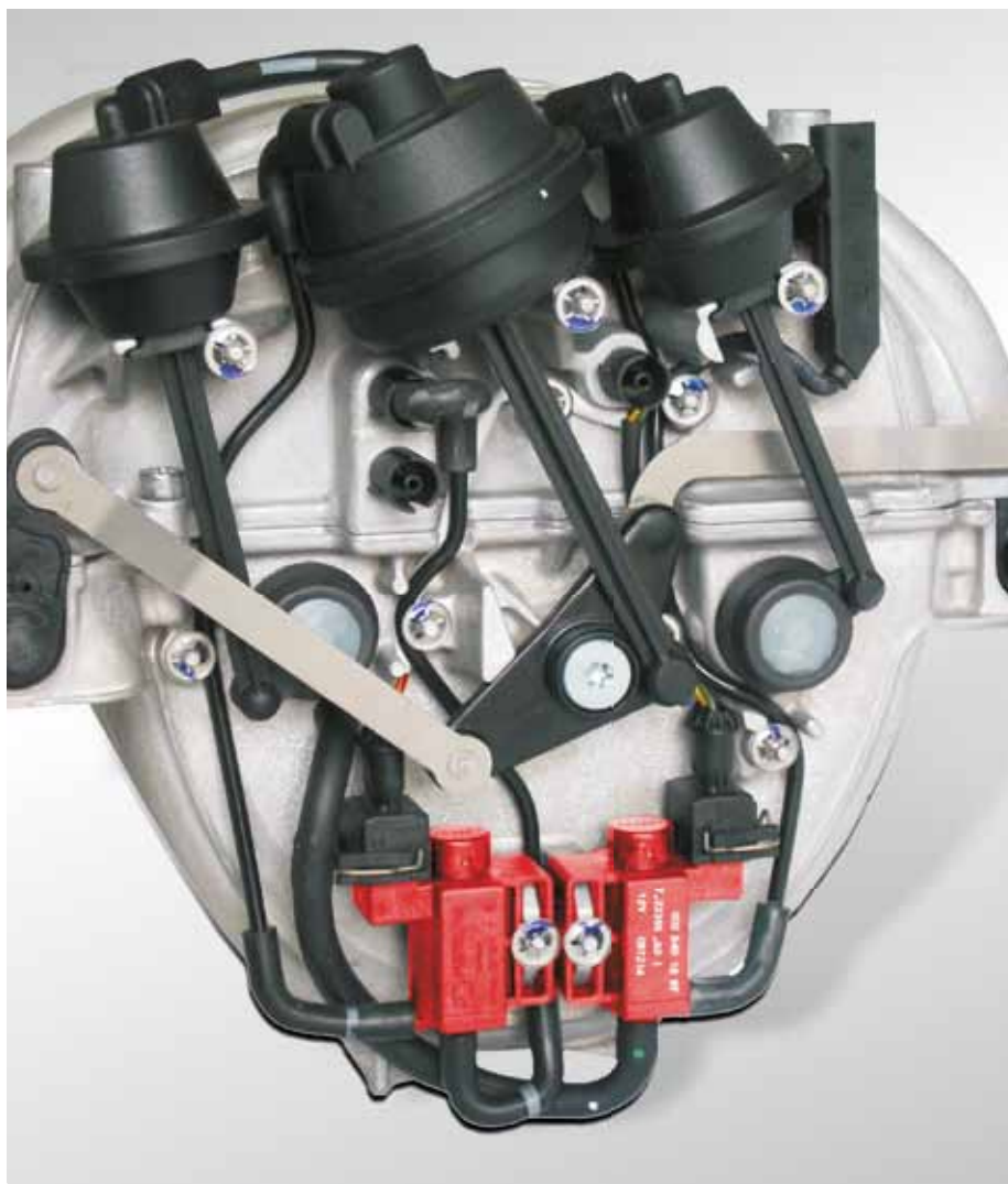
Exemplu de utilizare: Conductă de admisie cu supape electropneumatice (evidențiat cu roșu) la Mercedes clasa C

Aceste supape se găsesc în diferite variante de execuție și cu diverse denumiri (vezi informațiile de pe pagina 4). Modelele cele mai căutate ale acestor supape sunt indicate pe paginile următoare.