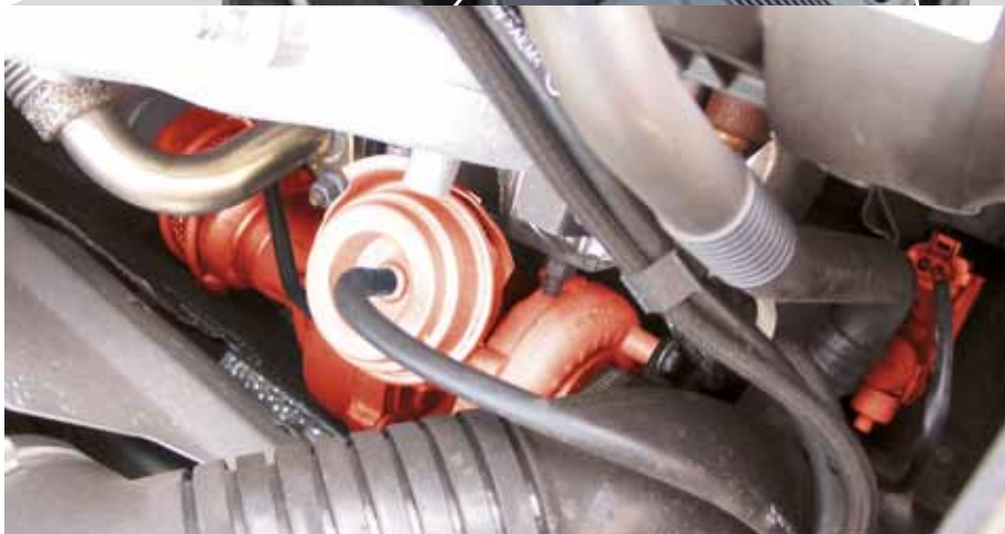
Convertorul electropneumatic de presiune (EPW) și turbina VTG (evidențiat cu roșu) la Audi A4 TDI