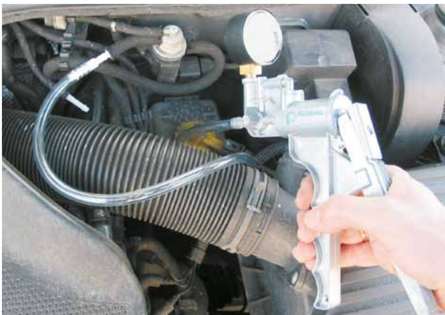
Verificarea unui convertor electropneumatic (EPW) cu pompa de vid manuală (VW Golf IV)

Supapele electropneumatice nu sunt monitorizate prin OBD (diagnoză on board) la funcționare, ci numai la penetrabilitate, scurtcircuit și legarea la masă. Defectele nu sunt astfel identificate cu exactitate, iar avariile sunt atribuite frecvent altor piese componente.