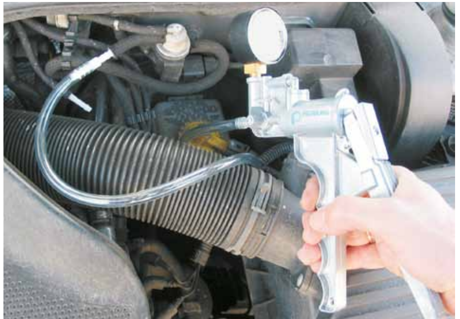
Az EPW vizsgálata kézi vákuumszivattyúval (VW Golf IV)

Ezért olyan szakemberre van szükség, aki jól ismeri a rendszert és nem hagyatkozik látatlanban a hibajelzésre, nem cserél ki egyszerűen egy alkatrészt, hanem utána jár és kideríti a hiba okát.