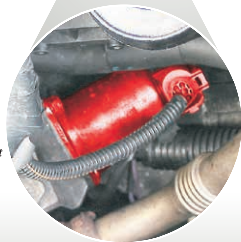
Клапан системы EGR в Renault Master JD1M (выделен)