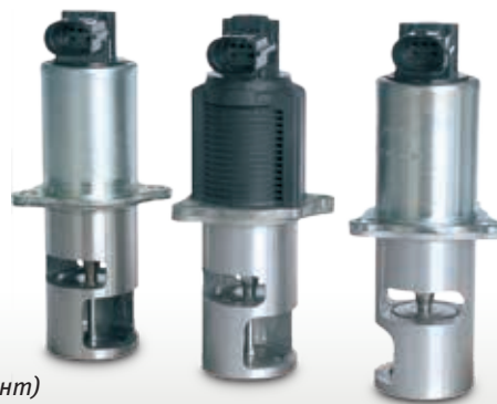
Вид продуктов (фрагмент)

Сохраняем за собой право на внесение изменений и на отклонения в иллюстрациях. Назначение и замена, см. действующие каталоги, компакт-диски TecDoc или же системы, базирующиеся на данных TecDoc.