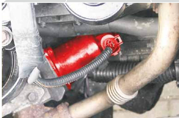
Válvula EGR no Renault Master JD1M (em destaque)