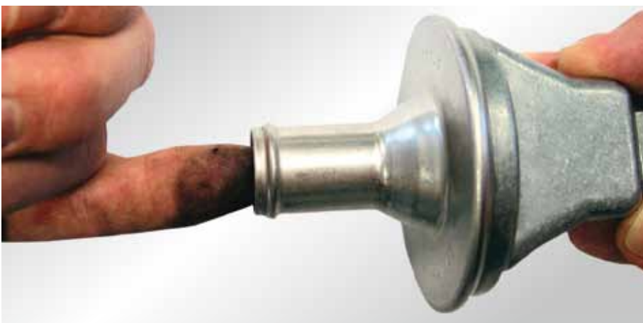
Eenvoudige controle van de terugslagklep

Wijzigingen en afwijkingen in afbeeldingen voorbehouden. Zie voor toewijzing en vervanging de betreffende geldige catalogi, TecDoc-CD resp. op TecDoc-Data gebaseerde systemen.