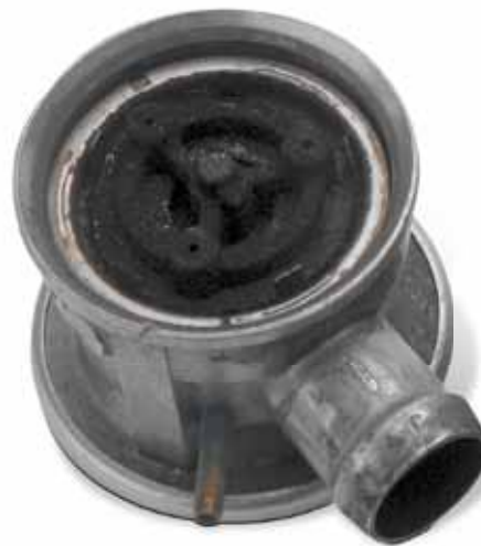
Schade door uitlaatgascondensaat

Mogelijke OBD-foutcodes zijn: P0410; P0411