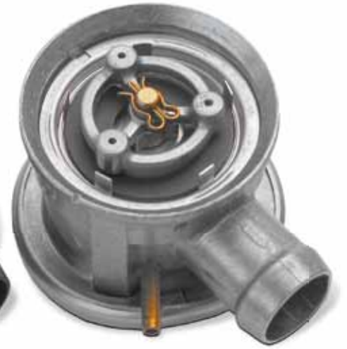
Ter vergelijking: Nieuwe toestand

In bijna alle gevallen wordt deze schade door uitlaatgascondensaat in de secundaireluchtpomp veroorzaakt.