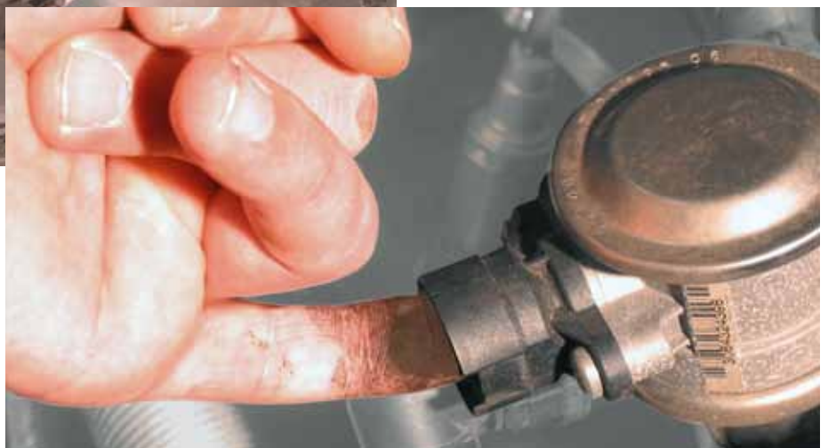
Sneltest aan secundaireluchtklep in BMW 520i (geaccentueerd)