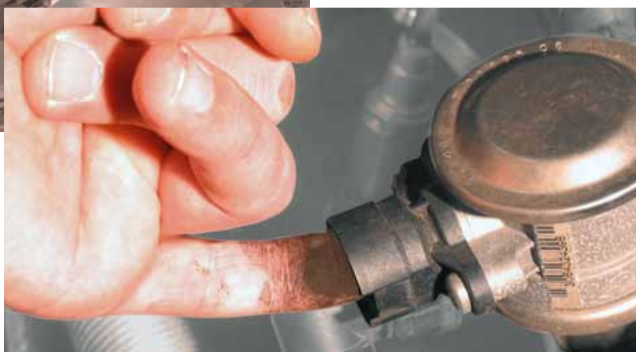
A BMW 520i szekunderlevegő-szelepének gyorsvizsgálata (kiemelve)