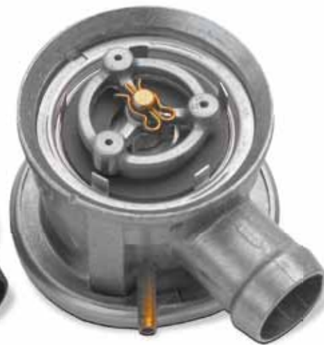
Hasonlítási alap: Új állapot

Ez a károsodás legtöbb esetben füstgázkondenzátum lecsapódásából ered. Javításkor gyakran csak a szekunderlevegő-szivattyút cserélik ki.