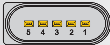
Atribuição de plugues

A verificação pode ser efetuada com o voltímetro ou osciloscópio.