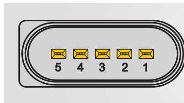
Ocupación de enchufes

La comprobación puede efectuarse con el voltímetro o el osciloscopio.