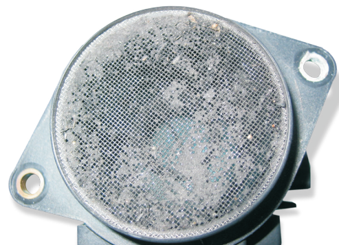
Sensore della massa dell'aria ostruito