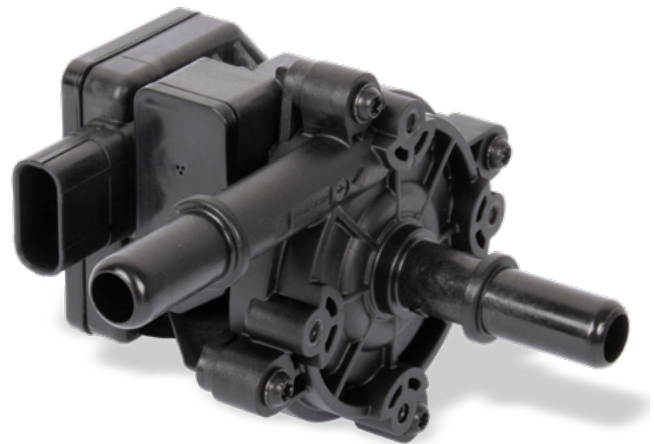
Pompa filtracji węglowej 7.11390.00.0