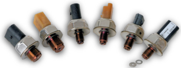
Capteurs de pression du carburant