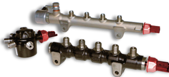
Capteurs de pression du carburant sur le rail (en rouge)