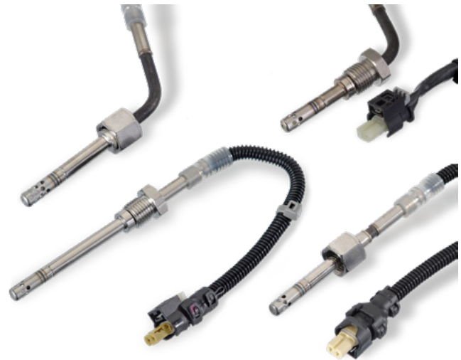
Четыре датчика температуры ОГ, применяемых в одном автомобиле Mercedes-Benz E-класса (W212.202)

БОЛЕЕ 130 ИЗДЕЛИЙ 1 700 ТИПОВ АВТОМОБИЛЕЙ 34 МИЛЛИОНА АВТОМОБИЛЕЙ