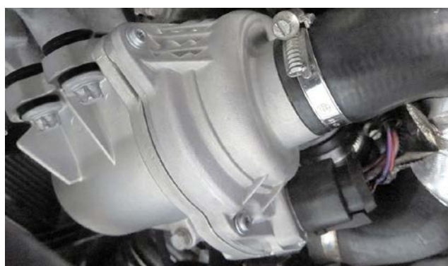
Pompe montée dans le véhicule