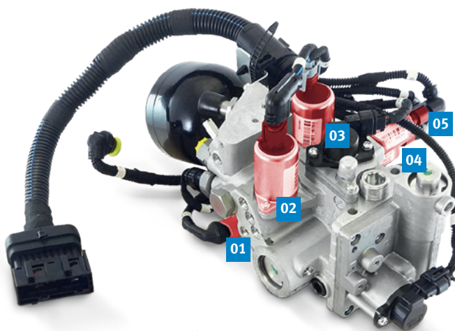
01–05 Fünf Steuerventile (rot hervorgehoben) am Schaltgetriebe Selespeed

Die Steuerventile dürfen deshalb nicht untereinander vertauscht werden.