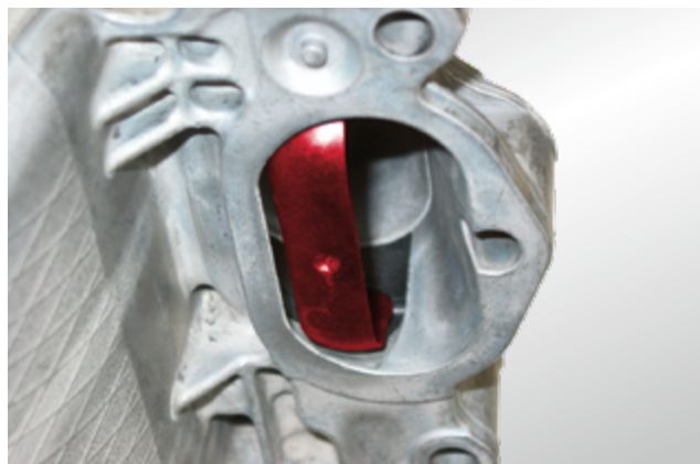
Clapet tumbler (en rouge) pour le mode charge stratifiée