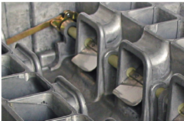
Vue de l'intérieur d'une tubulure d'aspiration à commande