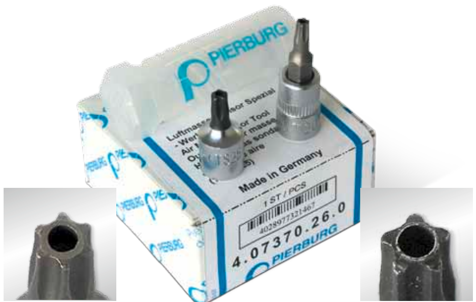
Insert T 20 (étoile à 6 branches, Torx®) avec forage à ergots

Le remplacement des débitmètres d'air massique montés en série est compliqué par l'utilisation de vis spéciales. Pour ce cas de réparation, Motor Service propose un nouveau kit d'outillage spécial se composant de deux inserts. La particularité de ces vis spéciales consiste en un goujon qui se trouve au centre du cinq ou six pans creux. Un forage à ergots est ménagé dans les inserts, ce qui permet de desserrer ces vis spéciales. Les deux outils consistent en inserts de 1/4 de pouce dans la qualité MSI éprouvée et conviennent pour toutes les clés à cliquet ou clés à douille usuelles de 1/4 de pouce.