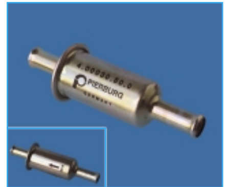
Vista del producto 4.00030.80.0

El filtro previo debería cambiarse al mismo intervalo de mantenimiento que el filtro de combustible.