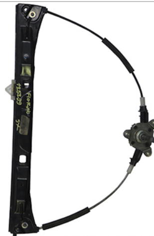
ORIGINAL POWER WINDOW ALZACRISTALLI ELETTRICO ORIGINALE