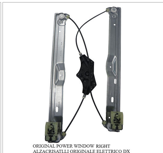
ORIGINAL POWER WINDOW RIGHT ALZACRISTALLI ORIGINALE ELETTRICO DX