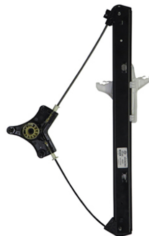
ORIGINAL POWER WINDOW RIGHT ALZACRISTALLI ELETTRICO ORIGINALE DX