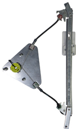
POWER WINDOW RIGHT ALZACRISTALLI ELETTRICO DX

THIS INSTALLATION INSTRUCTION IS FOR BOTH LEFT AND RIGHT SIDE. CETTE INSTRUCTION DE MONTAGE EST POUR LES DEUX COTES DROIT ET GAUCHE. DIESE MONTAGE-ANLEITUNG IST FÜR DIE BEIDE LINKE UND RECHTE SEITE. ESTA INSTRUCCION DE MONTAJE ES PARA LOS DOS LADOS IZQUIERDO Y DERECHO. AS PRESENTES INSTRUÇÕES VALEM TANTO PARA O LADO ESQUERDO QUANTO PARA O DIREITO. DEZE INSTRUCTIE IS GELDIG VOOR ZOWEL DE LINKERKANT ALS DE RECHTERKANT. ΑΥΤΗ Η ΟΔΗΓΙΑ ΕΧΕΙ ΚΑΙ ΤΗΝ ΑΡΙΣΤΕΡΗ ΠΛΕΥΡΑ ΚΑΙ ΤΗΝ ΣΩΣΤΗ ΠΛΕΥΡΑ. LA PRESENTE ISTRUZIONE VALE SIA PER IL LATO SINISTRO CHE PER IL LATO DESTRO.