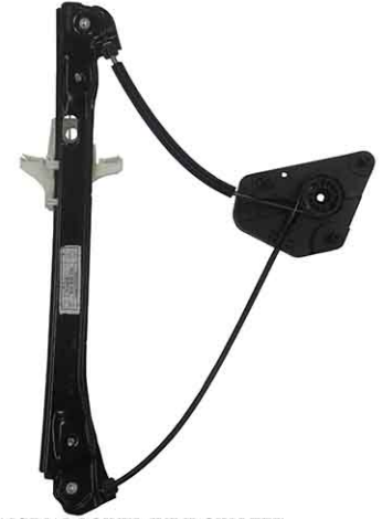
ORIGINAL POWER WINDOW LEFT ALZACRISTALLI ELETTRICO O ORIGINALE SX