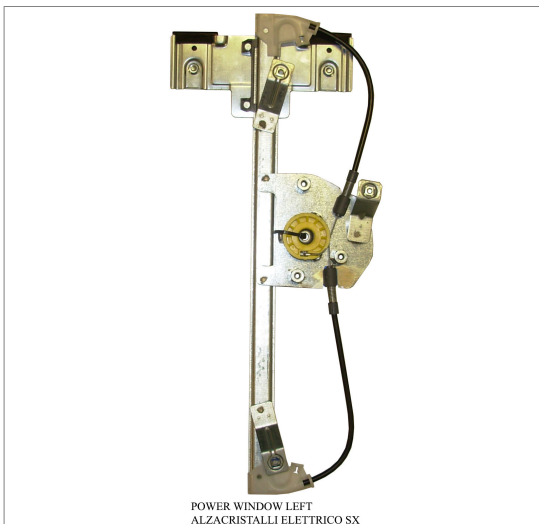
POWER WINDOW LEFT ALZACRISTALLI ELETTRICO SX

THIS INSTALLATION INSTRUCTION IS FOR BOTH LEFT AND RIGHT SIDE. CETTE INSTRUCTION DE MONTAGE EST POUR LES DEUX COTES DROIT ET GAUCHE. DIESE MONTAGE-ANLEITUNG IST FÜR DIE BEIDE LINKE UND RECHTE SEITE. ESTA INSTRUCCION DE MONTAJE ES PARA LOS DOS LADOS IZQUIERDO Y DERECHO. ESTAS INSTRUÇÕES VALEM TANTO PARA O LADO ESQUERDO QUANTO PARA O DIREITO. LA PRESENTE ISTRUZIONE VALE SIA PER IL LATO SINISTRO CHE PER IL LATO DESTRO.