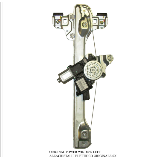
ORIGINAL POWER WINDOW LEFT ALZACRISTALLI ELETTRICO ORIGINALE SX