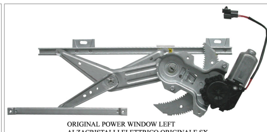
ORIGINAL POWER WINDOW LEFT ALZACRISTALLI ELETTRICO ORIGINALE SX