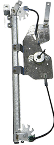
POWER WINDOW LEFT ALZACRISTALLO ELETTRICO SX

LA PRESENTE ISTRUZIONE VALE SIA PER IL LATO SINISTRO CHE PER IL LATO DESTRO.