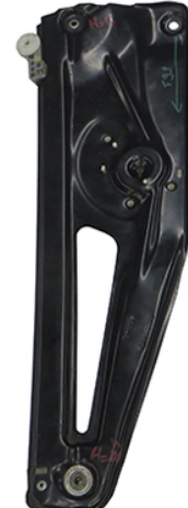
ORIGINAL POWER WINDOW LEFT ALZACRISTALLO ELETTRICO ORIGINALE SX