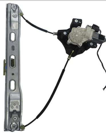
ORIGINAL POWER WINDOW RIGHT ALZACRISTALLI ELETTRICXO ORIGINALE DX