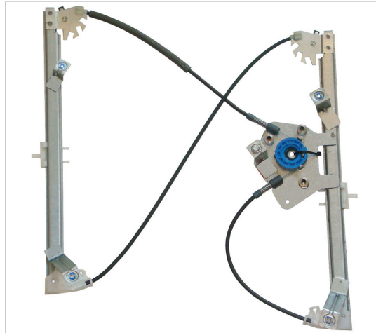
A POWER WINDOW LEFT ALZACRISTALLI ELETTRICO SX

THIS INSTALLATION INSTRUCTION IS FOR BOTH LEFT AND RIGHT SIDE. CETTE INSTRUCTION DE MONTAGE EST POUR LES DEUX COTES DROIT ET GAUCHE. DIESE MONTAGE-ANLEITUNG IST FÜR DIE BEIDE LINKE UND RECHTE SEITE. ESTA INSTRUCCION DE MONTAJE ES PARA LOS DOS LADOS IZQUIERDO Y DERECHO. ESTAS INSTRUÇÕES VALEM TANTO PARA O LADO ESQUERDO QUANTO PARA O DIREITO. DEZE AANWIJZINGEN GELDEN VOOR ZOWEL DE LINKER- ALS DE RECHTERKANT. Η ΠΑΡΟΥΣΑ ΟΔΗΓΙΑ ΑΦΟΡΑ ΤΟΣΟ ΤΗΝ ΑΡΙΣΤΕΡΗ ΟΣΟ ΚΑΙ ΤΗ ΔΕΞΙΑ ΠΛΕΥΡΑ. LA PRESENTE ISTRUZIONE VALE SIA PER IL LATO SINISTRO CHE PER IL LATO DESTRO.