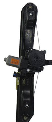
ORIGINAL POWER WINDOW RIGHT ALZACRISTALLI ELETTRICO ORIGINALE DX