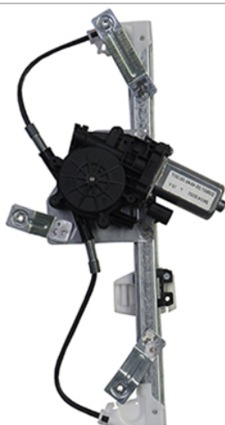
POWER WINDOW RIGHT ALZACRISTALLI ELETTRICO DX

THIS INSTALLATION INSTRUCTION IS FOR BOTH LEFT AND RIGHT SIDE. CETTE INSTRUCTION DE MONTAGE EST POUR LES DEUX COTES DROIT ET GAUCHE. DIESE MONTAGE-ANLEITUNG IST FÜR DIE BEIDE LINKE UND RECHTE SEITE. ESTA INSTRUCCION DE MONTAJE ES PARA LOS DOS LADOS IZQUIERDO Y DERECHO. AS PRESENTES INSTRUÇÕES VALEM TANTO PARA O LADO ESQUERDO QUANTO PARA O DIREITO. DEZE INSTRUCTIE IS GELDIG VOOR ZOWEL DE LINKERKANT ALS DE RECHTERKANT. ΑΥΤΗ Η ΟΔΗΓΙΑ ΕΧΕΙ ΚΑΙ ΤΗΝ ΑΡΙΣΤΕΡΗ ΠΛΕΥΡΑ ΚΑΙ ΤΗΝ ΣΩΣΤΗ ΠΛΕΥΡΑ. LA PRESENTE ISTRUZIONE VALE SIA PER IL LATO SINISTRO CHE PER IL LATO DESTRO.