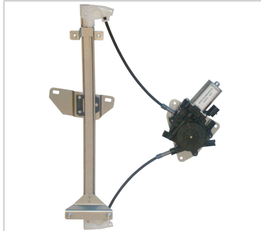
POWER WINDOW LEFT ALZACRISTALLI ELETRICO SX

THIS INSTALLATION INSTRUCTION IS FOR BOTH LEFT AND RIGHT SIDE. CETTE INSTRUCTION DE MONTAGE EST POUR LES DEUX COTES DROIT ET GAUCHE. DIESE MONTAGE-ANLEITUNG IST FÜR DIE BEIDE LINKE UND RECHTE SEITE. ESTA INSTRUCCION DE MONTAJE ES PARA LOS DOS LADOS IZQUIERDO Y DERECHO. ESTAS INSTRUÇÕES VALEM TANTO PARA O LADO ESQUERDO QUANTO PARA O DIREITO. DEZE AANWIJZINGEN GELDEN VOOR ZOWEL DE LINKER- ALS DE RECHTERKANT. Η ΠΑΡΟΥΣΑ ΟΔΗΓΙΑ ΑΦΟΡΑ ΤΟΣΟ ΤΗΝ ΑΡΙΣΤΕΡΗ ΟΣΟ ΚΑΙ ΤΗ ΔΕΞΙΑ ΠΛΕΥΡΑ. LA PRESENTE ISTRUZIONE VALE SIA PER IL LATO SINISTRO CHE PER IL LATO DESTRO.