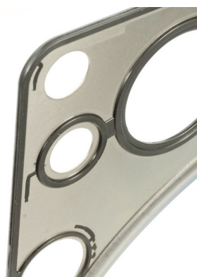
61-34285-20_Lèvre d'étanchéité plane