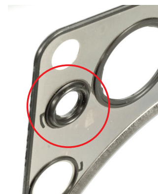
61-37770-00_Lèvre d'étanchéité surélevée de 3 mm