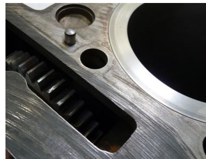
Motorblockdichtflächen mit Stirnrad

Maschinenpark und Know-how durchzuführen. Die konstruktive Anordnung der Ventilsteuerung durch Stirnräder in Zylinderkopf und Motorblock (siehe Bilder) macht es notwendig, dass das durch die maschinell bearbeitete Dichtflächen abgenommene Material durch eine entsprechend dickere Reparaturstufen Zylinderkopfdichtung ausgeglichen wird.