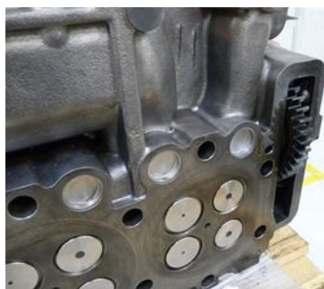
Zylinderkopfdichtfläche mit Stirnrad

Nach einer gewissen Laufzeit oder in Folge eines Schadens kann es zu erheblichen Beeinträchtigungen des Motors kommen, sodass eine Instandsetzung notwendig wird. Umfassendes technisches Verständnis ist erforderlich, um die komplexe Funktionsfähigkeit des Motors, wie sie vom Hersteller vorgesehen ist, wieder herzustellen. So müssen z.B. die Dichtflächen von Motorblock und Zylinderkopf vor jedem Arbeitsschritt sorgfältig auf ihren Zustand überprüft werden. Oftmals können sie nur durch präzises mechanisches Bearbeiten der Dichtflächen wieder in einen optimalen Zustand gebracht werden. Dieser Vorgang ist in einem spezialisierten Fachbetrieb mit entsprechendem