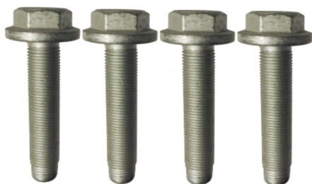
R159.64 : Peugeot 308 II